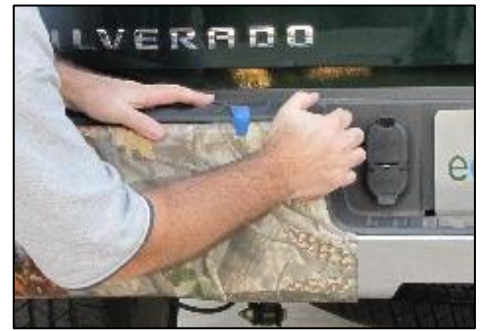
Tuck brida hasta la muesca

NOTA para la máxima adherencia: la cinta de espuma acrílica utiliza para cumplir su BumperShellz es "sensible a la presión", así que hacer Asegúrese de que haya suficiente presión aplicada a cada una de las zonas con cinta es vital para lograr una adhesión óptima de su BumperShellz™ a su tope. Se recomienda también que volver unas horas después o al día siguiente, para dar cada BumperShellz pieza otro roce de presión para garantizar mejor adherencia. Deje que el adhesivo de cinta fijado por al menos 24 horas antes de lavar tu carro. Adherencia máxima se alcanza después de 3-5 días a temperaturas superiores a 70 grados, ya si es más fresco. Una vez que el pegamento ha consolidado plenamente a una superficie adecuadamente preparada parachoques, es casi imposible quitar la BumperShellz sin dañarlos. Por favor, consulte "instrucciones de eliminación" en la sección de preguntas frecuentes de BumperShellz en el sitio web, si el retiro es necesario.